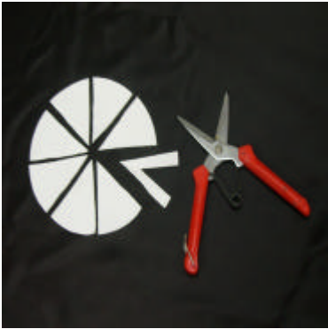
[ 1] 8